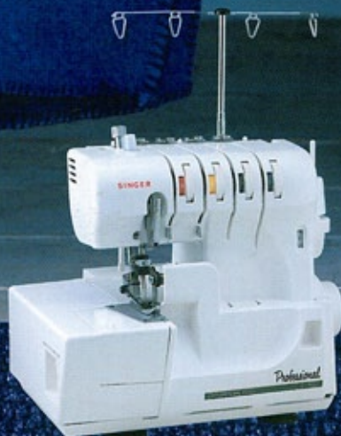
2本針4本糸かがりミシン(差動送り付) Professional S-400 131,250円