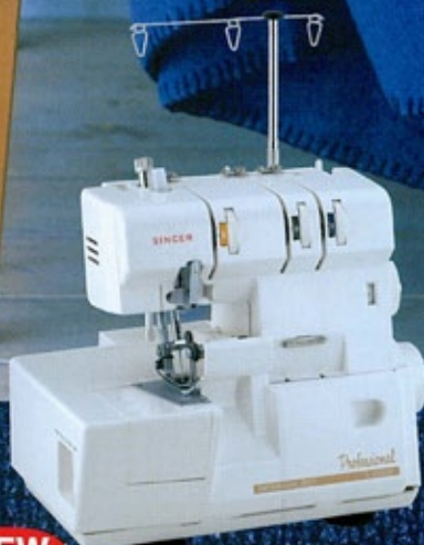
NEW 3本巻きロック&縁かがりミシン(差動送り付) Professional S-300DF オープン価格