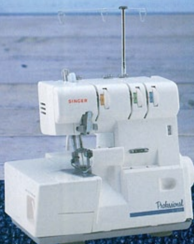
3本巻きロック&縁かがりミシン Professional S-300 オープン価格